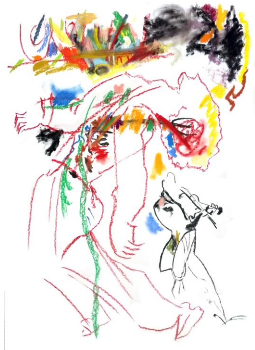
Tanzende Europa, © Alexander Kapitanowski