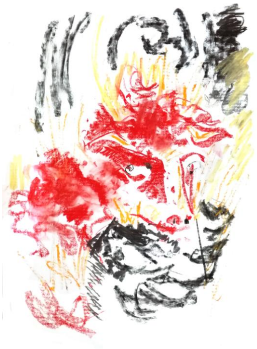
Der rote Stier, © Alexander Kapitanowski

Die Zeichnungen von Alexander Kapitanowski sind ein Versuch, einen altgriechischen Mythos zu befragen, neu zu definieren und zu transformieren – das heutige Europa durch die Antike zu lesen.