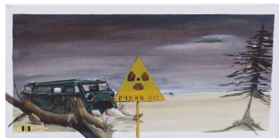
Zone, © Thorsten Böckmann