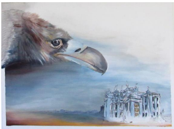
Haus mit Chimären

Thorsten Böckmanns „Ansichtssachen“, stellen nicht die Realität vor Ort dar, sondern spiegeln persönliche Eindrücke. Im Fokus stehen die ukrainische Hauptstadt Kiew und Tschernobyl.